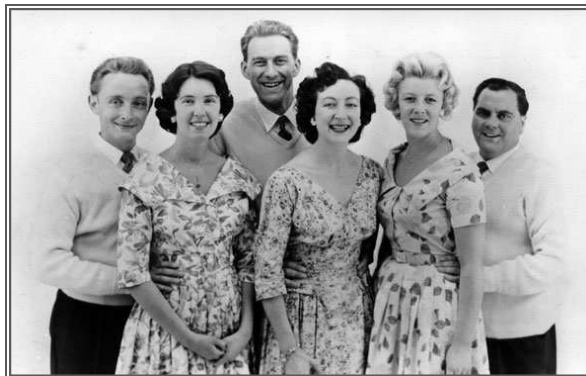
The Mike Sammes Singers

Er bestaat ook een Congolese persing van deze single op een roze Parlophone label met serienummer R5655.